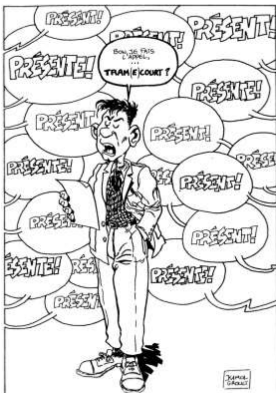
Extrait des Actes du congrès national d'Arras (1989): l'enquête TRA (Laboratoire de Démographie historique) ... à travers l'exemple des TRAMECOURT.