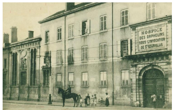
« hospice des enfants trouvés de Nancy », devenu « hospice des orphelins » après 1815.

Cercle généalogique du Toulinois : Nancy, les enfants abandonnés. ⇒ https://bit.ly/2HMKdaU