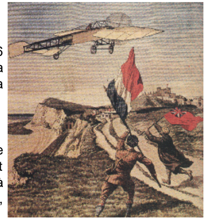
La traversée de la Manche

L'année suivante François Mitterand est élu président de la République. . En 1992 c'est la création de l'Union Européenne et depuis de nombreuses technologies ont vu le jour : la parabole, l'Internet, le téléphone portable, des fusées de plus en plus puissantes. J'ai vécu un siècle. C'était un siècle de changements et de progrès constants.