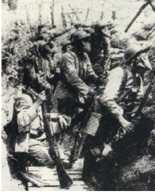
Le front de 1916 à Verdun