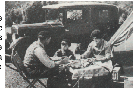
Les premiers congés payés