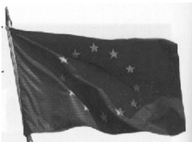
Le drapeau Européen