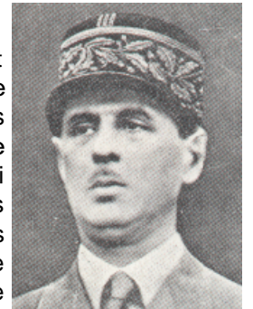
Le général de Gaulle