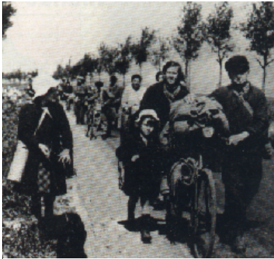
L'exode en 1940